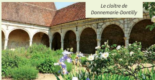
Le cloître de Donnemarie-Dontilly

« Mouchérons », « abeilles », « bouffons », « militaires », « araignées », « sabot de vénus », les appellations des orchidées précisent la couleur et la forme de leurs pétales roses, pourpres, verdâtres, blanches, ou jaunes-verts. La race céphalantère rouge à lèvres pointue pousse dans les forêts sèches et sur les sols calcaires. Inutile de préciser que ces orchidées protégées ne doivent pas être cueillies, mais seulement photographiées.