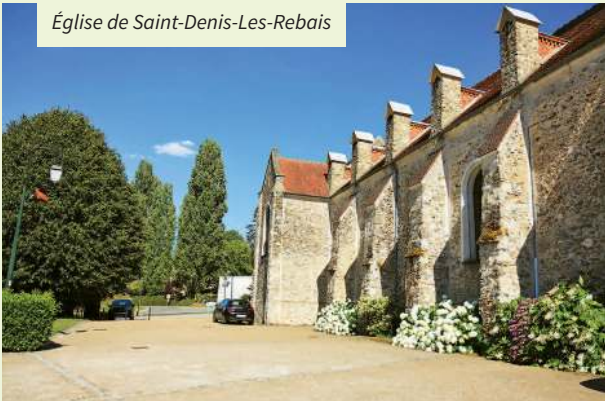
Église de Saint-Denis-Les-Rebais

A noter un édifice peu courant dans la région : un temple protestant a été bâti en 1858 dans le hameau de Mazagran distant de 1,5 km à l'ouest de Saint-Denis-lès-Rebais.