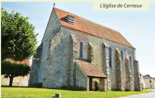
L'église de Cerneux

Au service du roi Henri III en 1589, il s'offre une armée de mercenaires suisses, grâce à la vente du fameux diamant aux anglais. Il mène campagne en Savoie pour le roi, qui n'a rien déboursé. C'est ainsi qu'il conquiert le pays de Gex en Suisse, il sera rattaché à la France en 1601.