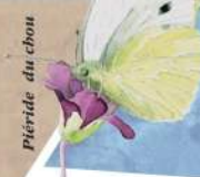
Piéride du chou

AGRENABA | Carte, carnet, hibou, mousse, ciel, myriapode, argile : Pixabay Chevreuil et Canard siffleur : Alain Souchet Rainette verte : Françoise Serre Collet Brebis : Brebis laine | Bouvière : FDP77 Coccinelle et piéride : Gabriel Gibert