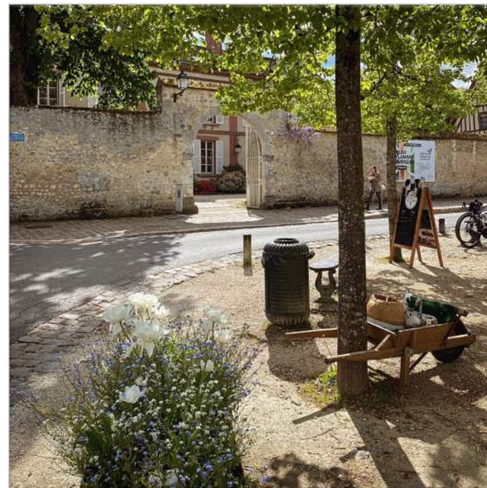
Hôtel de Savigny, place du Chatel

Le salon proposera également aux visiteurs des démonstrations afin de les initier aux gestes, aux outils, aux techniques et processus de fabrication.