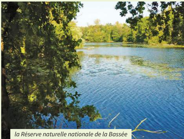
la Réserve naturelle nationale de la Bassée

Avec plus de 614 espèces végétales recensées, soit 40 % de la flore d'Île-de-France, la réserve abrite de nombreuses plantes protégées comme la vigne sauvage dont la population compte parmi les plus importantes de France.