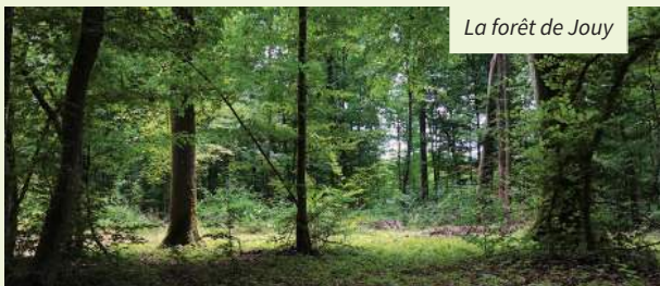
La forêt de Jouy

Édition Provins Tourisme - Codérando 77 - Conception et réalisation : CréaClic - 10/2024 - Informations susceptibles de modifications.