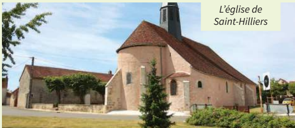
L'église de Saint-Hilliers

Il y avait un château seigneurial et un donjon dès le XI e siècle à Quincy. Du XVI e siècle à la révolution, des seigneurs se sont succédé sur ce domaine ; deux familles sont restées chacune un siècle, les Brunfay et les du Tillet. Du château, il ne reste rien, seul le donjon subsiste. Une belle ferme anime ce hameau.