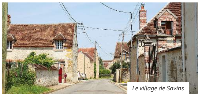
Le village de Savins