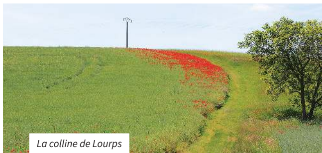
La colline de Lourps

5 Prendre le chemin à droite. Il sort du bois. Au niveau du réservoir, continuer par la route en face et passer le calvaire. Bifurquer à droite sur le sentier qui descend, puis suivre la rue de la Fontaine à gauche. Par la rue du Château-d'Eau à droite, regagner l'église de Savins.