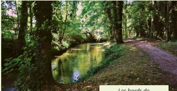
Les bords de la Voulzie

À l'époque mérovingienne, puis carolingienne, un village se fixe sur les hauteurs sous le nom de Poigny comme le prouve un écrit de 1265. Des vestiges de l'église Saint-Michel des VI e , XIII e et XVII e siècles ont été retrouvés. A la fin du Moyen Âge au XV e siècle, les habitants s'installèrent en contrebas le long d'une route de la vallée.