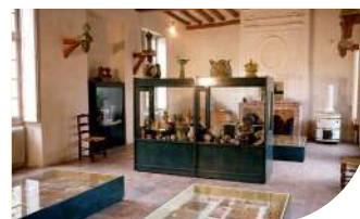
4 LE MUSÉE DE PROVINS ET DU PROVINOIS