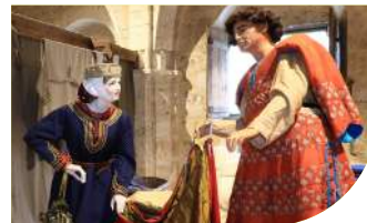
2 LA GRANGE AUX DÎMES