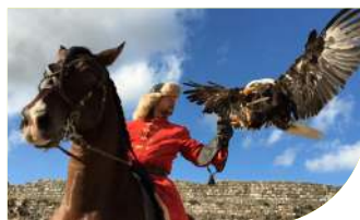
6 LES AIGLES DES REMPARTS