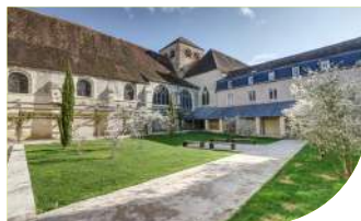
3 LE PRIEURÉ DE SAINT-AYOUL