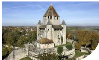
1 LA TOUR CÉSAR